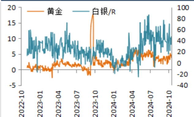
图3：上海期指对上金TD基差