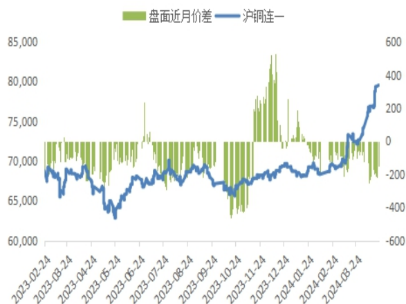
图1：沪铜走势及盘面价差